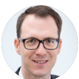
Sascha Winter Akademie der Sparkassen-Finanzgruppe Saar

06131 145-385 regine.schreiter@sv-rlp.de