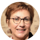
Iris Hotfilter Sparkassenakademie Nordrhein-Westfalen

0231 22240-789 barbara.doerr-lappe@ska.nrw